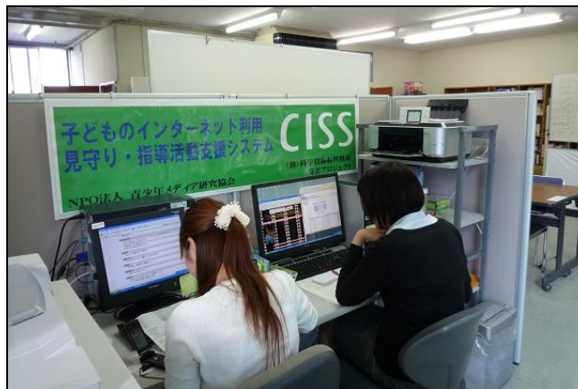
写真1：ネットモニタリングの様子

特にモデル校においては、ネットの見守り活動から整理したソーシャルグラフと学校現場で教師が把握している生徒の様子とのすり合わせを行い、生徒理解や状況把握を補強するためのツールとして、その活用を行なった。